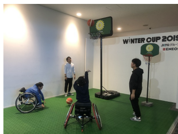
車いすバスケ体験