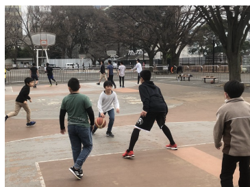
代々木ストリートバスケ