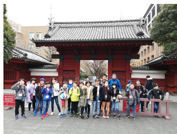
東京大学の赤門前