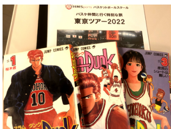
新幹線・スラムダンク貸出