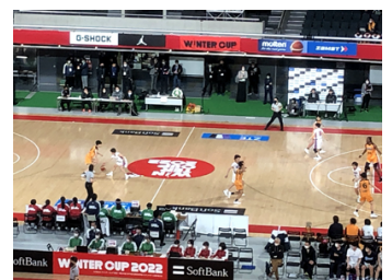
ウインターカップ観戦